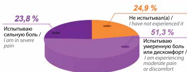
Рис. 1. Процентное соотношение пациентов, испытывающих болевые ощущения, связанные с заболеванием

Как видно из табл. 5, за 9 мес 2025 г. зафиксирован рост обращений по препаратам, не входящим в перечень ЖНВЛП, на 5 % по отношению к аналогичному периоду 2024 г.