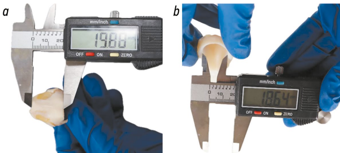
Рис. 2. Методика морфометрических измерений перстневидного хряща: a — высота пластинки перстневидного хряща (X2), определяемая как вертикальное расстояние между верхним и нижним краями по срединной линии; b — внутренний поперечный диаметр (X5), определяемый как наибольшее расстояние между боковыми стенками просвета перстневидного хряща.

поперечный диаметр (X5). Вертикально вдоль соответствующих срединных линий измеряли высоту пластинки (X2) и дуги (X3) перстневидного хряща. Толщину соответствующих структур измеряли по срединным линиям пластинки (X7) и дуги (X8), а также по боковым поверхностям правой (X9) и левой (X10) пластинок. Для измерения суставных поверхностей определили следующие параметры: поперечное расстояние между суставными поверхностями перстнещитовидного сустава (X6), расстояние между верхней (X11) и нижней (X12) точками суставных поверхностей перстнечерпаловидного сустава, расстояние от нижнего края суставной поверхности перстнещитовидного сустава до нижнего края перстнещитовидного хряща справа (X13) и слева (X14), а также расстояние между суставными поверхностями перстнечерпаловидного и перстнещитовидного суставов справа (X15) и слева (X16). В завершение определили общую массу перстневидного хряща